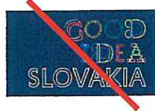
Nepripustný spôsob olemovania elementov Unacceptable manner of bordering elements