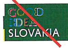
Nepripustná farebnosť logotypu Unacceptable colour scheme of the logotype