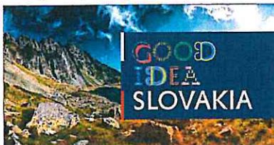
Aplikácia logotypu na fotografickom podklade Application of the logotype on photographic background