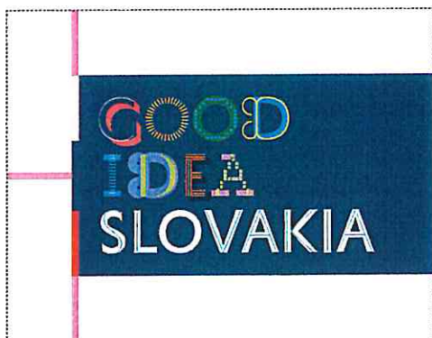
The minimum protection zone at the preferred placement of the logotype to the right edge of the format

Minimálna ochranná zóna pri preferovanom osadení logotypu k pravému okraju formátu