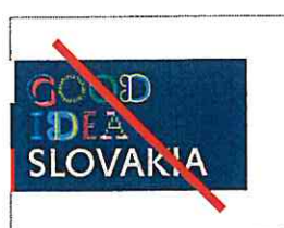
Nepripustné priradenie logotypu k inému ako k pravému okraju formátu Unacceptable alignment of the logotype to any different, but the right logotype border