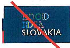
Veľkosť a pozícia jednotlivých elementov sú vo vzájomnej disproporcii Size and position of different elements are mutually disproportionate