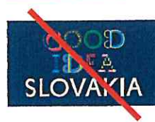
Nepripustná kompozícia elementov Unacceptable composition of elements