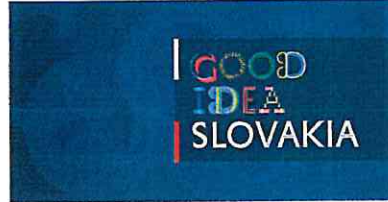
Aplikácia logotypu na podklade s textúrou Application of the logotype on the background with texture