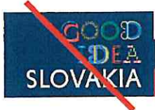
Nepripustná kompozícia elementov Unacceptable composition of elements