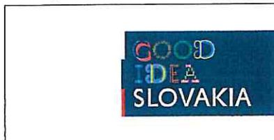
Aplikácia logotypu na bielom podklade Application of the logotype on white background