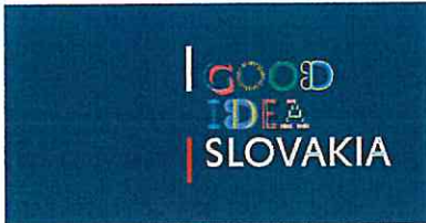
Aplikácia logotypu na podklade predpísanej modrej farby Application of the logotype on the background with prescribed blue colour