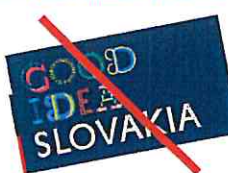
Nepripustné natočenie logotypu Unacceptable orientation of the logotype