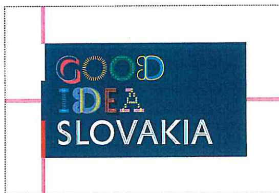
The minimum protection zone when the logotype is applied freely in area of the format

Minimálna ochranná zóna pri aplikácii logotypu voľne do priestoru formátu